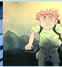
LA TÊTE DANS LES ORTIES