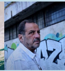
L'IMMEUBLE DES BRAVES