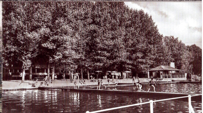
Gymnase 1891 (160 membres en 1908) - Stand de tir (600 adhérents en 1908) - Stade de foot 1928 (jusqu'à 300 licenciés) - Piscine 1931 (500 baigneurs/j dans les années 1950)