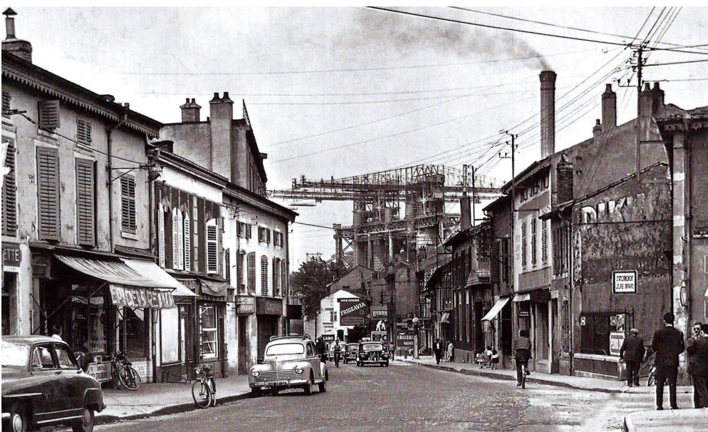
Rue Gabriel Péri vers 1960. Pour Solvay, c'était Dombasle pour Dombasle c'était Solvay. On pouvait apercevoir ces 4 énormes grues « Aéros » aux 4 coins du territoire de Dombasle.