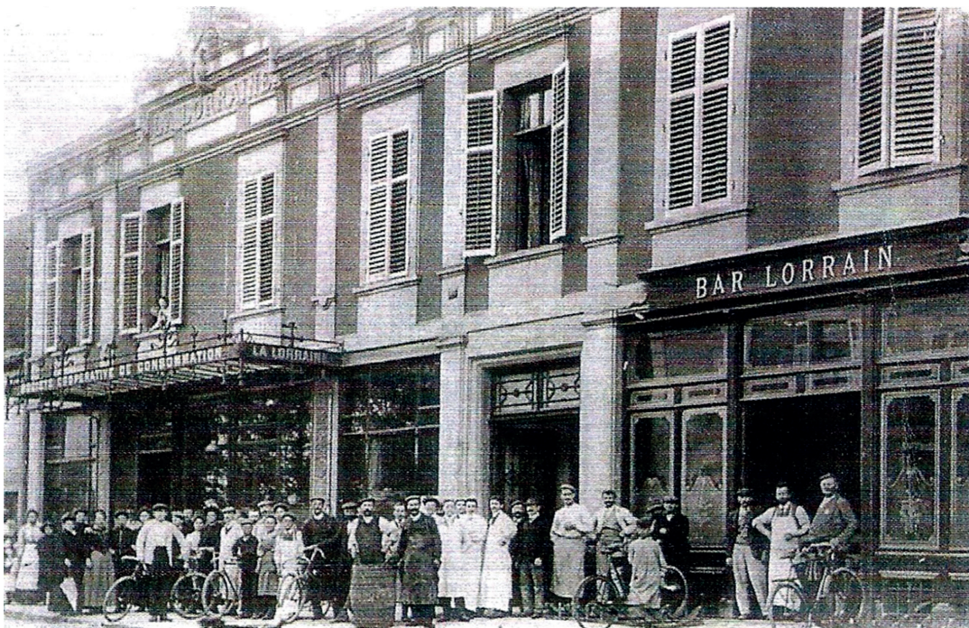
Création en 1894 d'un économat Solvay durant 90 ans : Société Coopérative « La Lorraine » et Bar Lorrain en 1910.

Depuis le quartier du Stand, une voie ferrée type Decauville approvisionne en briques le nouveau chantier de construction du quartier du Maroc pour les ouvriers, puis en 1920, les quartiers du Transwal et de la Mandchourie pour les employés (noms de régions où Solvay possède des intérêts).