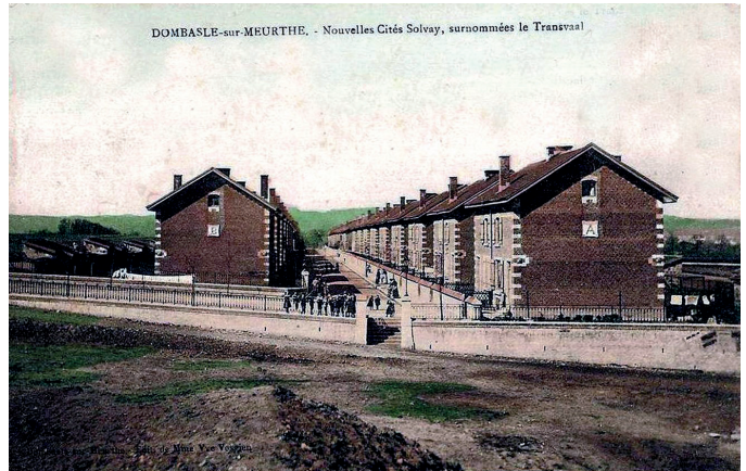
Rangées de cités érigées vers 1907 au quartier dit « Transwal », état Boer d'Afrique du Sud où Solvay possédait des intérêts économiques.