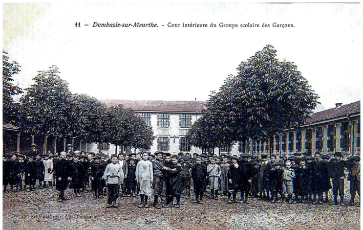
École de garçons Marcel Leroy en 1900

Privé de sport durant sa jeunesse, M. Solvay était convaincu que les hommes devaient cultiver leur corps par la pratique d'activités culturelles ou sportives. Pour prétendre étudier dans ses écoles, il fallait obligatoirement pratiquer ces disciplines dans les bâtiments stades, piscine ou gymnase mis à leur disposition. La Société Dombasle Sport remporte de multiples concours, récompenses et titres au fil de son existence.