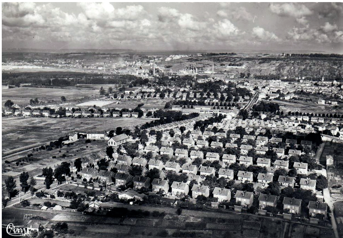
Quartier du Maroc 1955, programme de construction de 450 cités à partir de 1906.