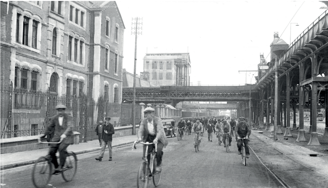
Dans les années 1930, le personnel Solvay se rendait au travail en vélo, le flot de plus de 400 cyclistes était spectaculaire aux heures d'embauches et de fin de postes. - Sortie d'ouvriers des usines Solvay, rue Nationale

D'autres réalisations sont édifiées pour les cadres en 1880, rue de la Gare, devenue Estienne d'Orves ; puis en 1909, rue Laennec, en 1926, rue Pierre Breton, et en 1938, rue Albert Premier.